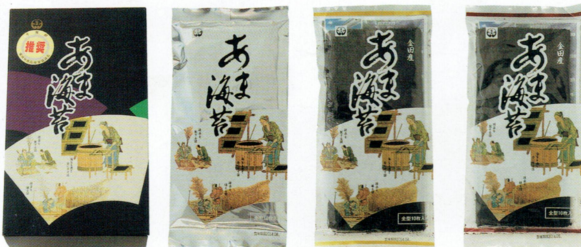
10帖化粧箱 HA HK HC

旬の時期に摘み採ったあま海苔を、 焼かずにそのまま一帖ずつ パックしました。 (各種、青まぜのりも、御座います。)