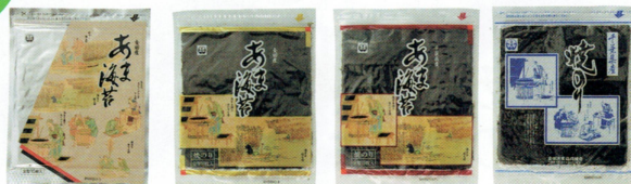
YA YK YC YM

一枚一枚真心を込めて丁寧に 焼き上げました。 (各種、青まぜのりも、御座います。)